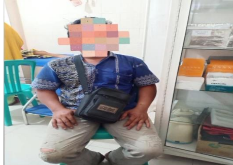
Gambar 1.2 wawancara pasien di IGD