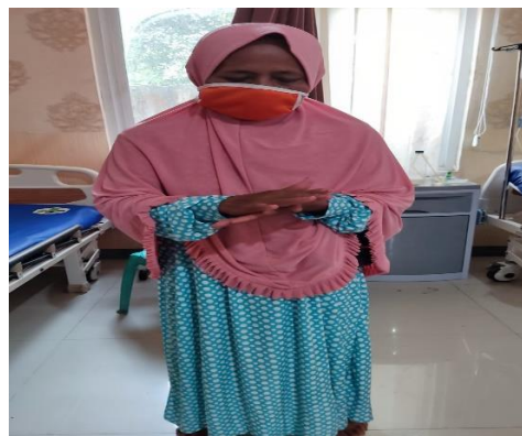
Gambar 1.3 wawancara keluarga pasien di Ruang Rawat Inap